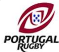
Federação Portuguesa de Rugby