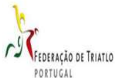
Federação Portuguesa de Triatlo